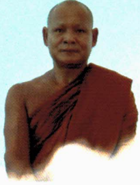
พระอาจารย์ทองปาน จารุณุลูณ