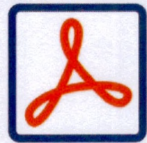
Sign with Acrobat

ติดตั้งระบบผ่านโปรแกรมสำเร็จรูป JAR File ตามคู่มือของประเทศไทย เพียงไม่กี่ขั้นตอน เอกสารจะได้รับ การประทับรับรองเวลาอย่างสมบูรณ์