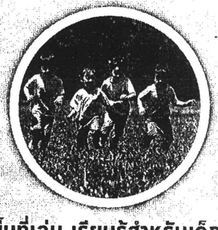
พื้นที่เล่น เรียนรู้สำหรับเด็ก และครอบครัว ฯลฯ