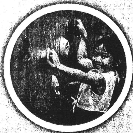
ปลดปล่อยเส้นทางการเล่น สู่การเรียนรู้ของเด็ก