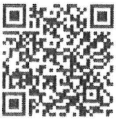
สแกน QR Code สำหรับลงทะเบียน

จึงเรียนมาเพื่อโปรดอนุเคราะห์ประชาสัมพันธ์ จะขอบพระคุณยิ่ง