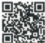
แผ่นประชาสัมพันธ์