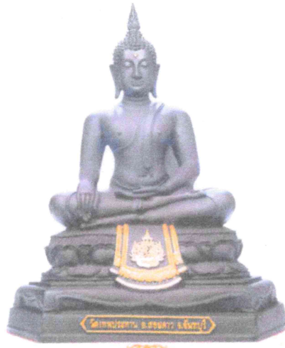
หน้าตัก ๕ นิ้ว