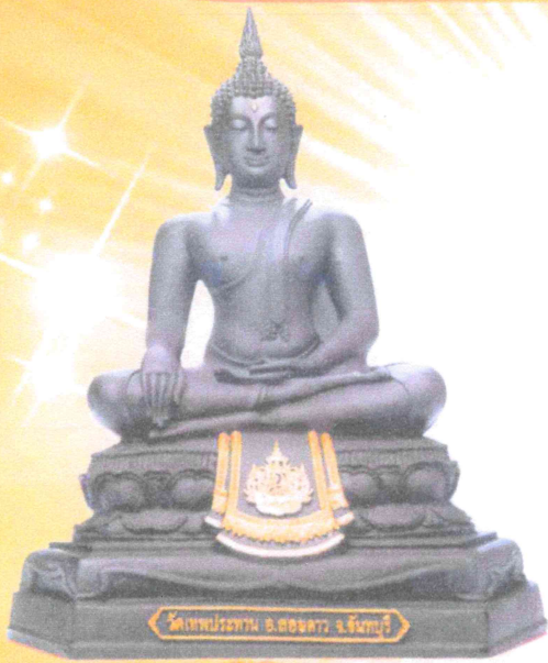
หน้าตัก ๙ นิ้ว

เนื่องในโอกาสพระราชพิธีมหามงคลเฉลิมพระชนมพรรษา ครบ ๗ รอบ ๕ ธันวาคม ๒๕๕๕