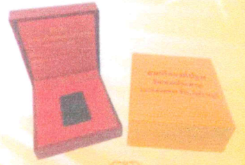
พระพิมพ์